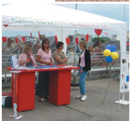
An Informationsständen verteilen wir Materialien für betroffene Eltern und machen die Öffentlichkeit auf uns aufmerksam

Unsere Arzt-Eltern-Seminare bieten die Gelegenheit zur Information über aktuelle medizinische Erkenntnisse und regen zum gemeinsamen Dialog an. Unsere Öffentlichkeitsarbeit, die alle Veranstaltungen begleitet, soll die Bevölkerung aufklären und ein Bewusstsein für herzkranken Kinder schaffen.