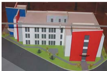
Das Modell des neuen Kinderherz-Transplantationszentrums Gießen

Unser Verein und das Team der Kinderkardiologie und Kinderherzchirurgie arbeiten seit vielen Jahren vertrauensvoll zusammen, um die Situation herzkranker Kinder stetig zu verbessern.